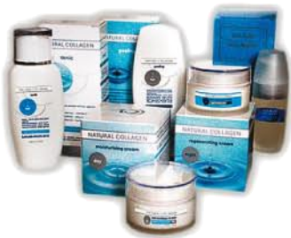
Lolita Young Gamme Nutricosmétique de Collagène France

Pendant, le collagène a des propriétés en cosmétologie : comme toutes les grosses molécules appliquées sur la peau, elle retient l'eau et donne un effet pulplant. En séchant, le collagène se rétracte et provoque l'effet « lift » ou « flash » qui – forcément ! - ne dure pas longtemps.