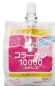
Lotte Jus de raisin avec 10 000 mg de collagène & 11 vitamines - Japon

Ainsi, il faut longtemps – plus de 3 heures de cuisson – pour séparer les fibres de collagènes d'un jarret de bœuf, pour permettre sa dégustation, son assimilation, son utilisation par l'organisme. C'est dire combien cette molécule peut être solide et durable.