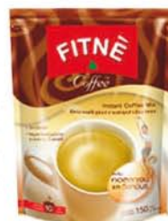
Fitné Café instantané & Collagène Malaisie