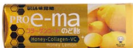
Proe-ma Bonbon miel & collagène - Japon