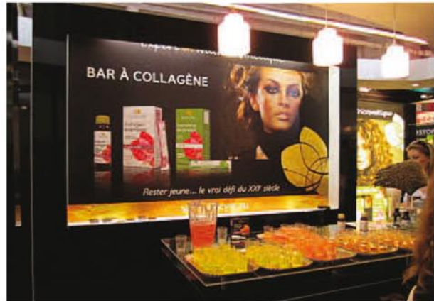
Biocyte Bar à collagène Pharmagora 2011 France