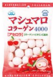
Marshmallow au collagène Japon

Le collagène cutané est essentiellement contenu dans le derme, synthétisé par les fibroblastes.