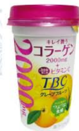
Morinaga Boisson contenant 2000 mg de Collagène Japon