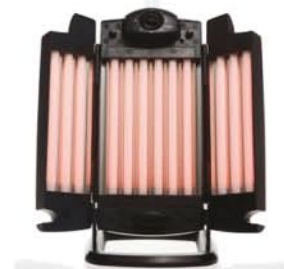
TONIC VIBES® - Lampe Collagène 12 tubes l'anti-ride naturel ! France