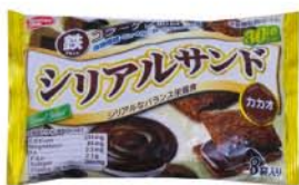
Healthy Club Biscuits au chocolat & Collagène Malaisie