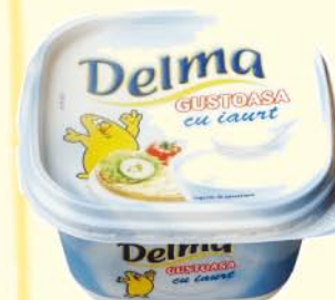
Delma - Margarine 39 % au yaourt Roumanie