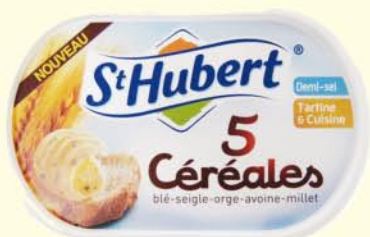
St Hubert 5 céréales France

Le beurre bénéficie de la TVA à taux réduit (5,5 %) commune à presque tous les produits alimentaires « natifs » tandis que les margarines et matières grasses végétales continuent à se voir imposer un taux majoré (19,6 %). Mine de rien, ce protectorat est commercialement très avantageux pour le beurre.