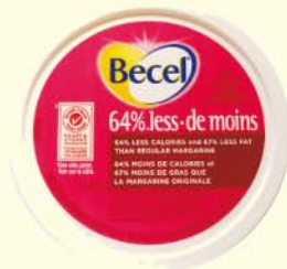
Becel - Margarine allégée Canada