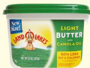
Land o Lakes - Beurre allégé à l'huile de colza - USA