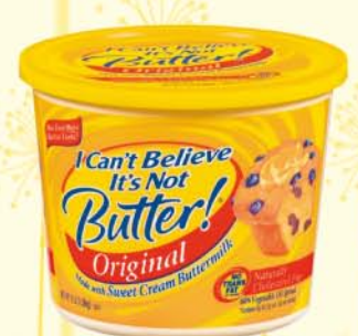
Unilever - I can't believe it's not butter! USA - DR