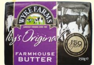
Wyke Farm - Beurre traditionnel UK