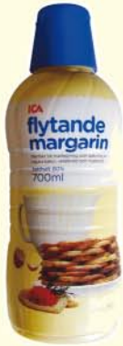
Ica Margarine liquide 80% Suède

Jusqu'aux années 1995, les acides gras trans pouvaient composer plus de 10 % des « margarines », parfois même 20 %. Alors qu'aujourd'hui, un taux de 2 % de trans signe un produit à éviter absolument ! Les progrès ont donc bien été faits. Bravo.