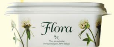
Flora - Margarine 80% - Suède - DR

A choisir, mieux vaut alors 1000 fois l'huile !