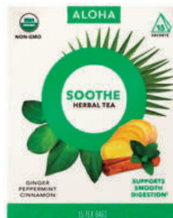
Soothe - Organic herbal tea USA