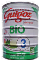
Guigoz Bio - Step 3 France