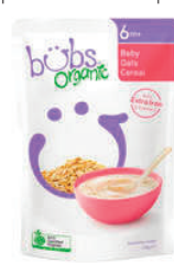
Bubs Organic - Céréales Bio Australie

risque pour les enfants d'agriculteurs conventionnels qui utilisent certains intrants, pour le cancer du testicule, notamment. Le respect des consommateurs n'est que la cerise sur le gâteau, mais quel gâteau !