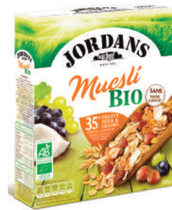
Jordans - Muesli Bio France