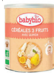
Babybio - Céréales Bio France