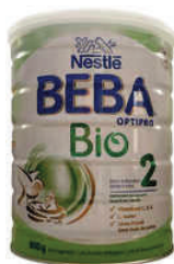
Nestlé Beba Bio Suisse

Ces critères sont très stricts. Alors qu'apporte le BIO pour cette catégorie déjà très « propre » ? Encore moins de pesticides et de résidus, et un bénéfice certain pour l'environnement, et le cadre de vie de vos bébés.