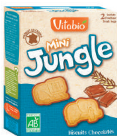
Vitabio - Mini Jungle Bio Singapour

Ces résultats indiquent bien que les motivations premières pour ne pas aller vers le BIO sont une indifférence aux contaminants et le choix du prix. Au contraire, le choix du Bio est motivé par la Santé, quel qu'en soit le prix.