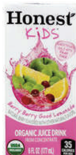
Honest Kids - Organic juice drink Philippines