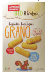
Bio Bimbo - Biscuits Italie

Résolution BIO. Pour toutes les raisons écologiques, respect animal mais aussi respect des producteurs. On ne peut pas oublier le plus fort