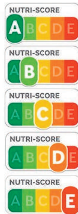
Logo Nutri-Score

Ainsi, certains aliments sont réputés « peu sains » : frites, mayonnaise, saucissons... mais pour autant, certains bénéficient de « bons scores », d'autres non. Par exemple, certaines frites sont notées C, d'autres D ou E. Ces notes vous indiquent clairement les meilleurs choix parmi les frites. Et dans tous les cas, ces notes D ou E vous incitent à être raisonnable à la fois dans la fréquence de consommation et dans les quantités consommées.