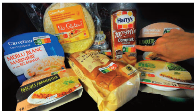
Packagings Harry's, Carrefour, Carrefour Bio, avec Nutri-Score

Pour les industriels qui voudraient bénéficier du logo sur leurs produits, ils trouveront à leur disposition un « modus operandi » et les conditions d'utilisations (gratuites, mais il y a des conditions, comme par exemple, on n'utilise pas le logo seulement sur les produits qui ont une bonne note, mais sur toute la gamme).