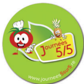
Journée 5/5 - www.journee5sur5.re - DR

Le pire : une pizza faite d'une pâte grasse (farine, graisse de palme) et d'une garniture de type « succédané ». Le meilleur : une pizza avec une pâte à pain, des tomates, de la mozzarella et des herbes. Simple ?