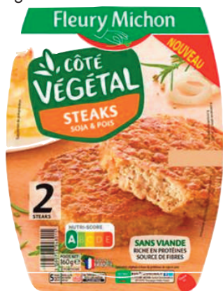
Fleury Michon - Packaging avec Nutri-Score

Pour les industriels qui voudraient bénéficier du logo sur leurs produits, ils trouveront à leur disposition un « modus operandi » et les conditions d'utilisations (gratuites, mais il y a des conditions, comme par exemple, on n'utilise pas le logo seulement sur les produits qui ont une bonne note, mais sur toute la gamme).