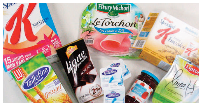
Produits allégés sur le marché français - DR

Comment un consommateur « moyennement informé » comme ils disent à la répression des fraudes, peut-il faire honnêtement et raisonnablement ses courses avec un double objectif de manger sainement tout en se faisant plaisir ?