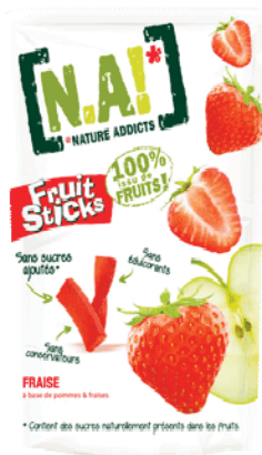
NAI - Fruits sticks

Selon une étude de TNS 1 (2015), réalisée pour GNT, des informations claires relatives aux ingrédients et aux additifs sont essentielles dans la décision d'achat de produits alimentaires et des boissons, pour 67 % des consommateurs. Ainsi, 47 % des Français interrogés attachent une grande importance à l'absence de colorants artificiels dans les produits qu'ils achètent ; Une autre étude (TNS 2013), montre que 63 % des Français recherchent des produits exempts de produits chimiques.